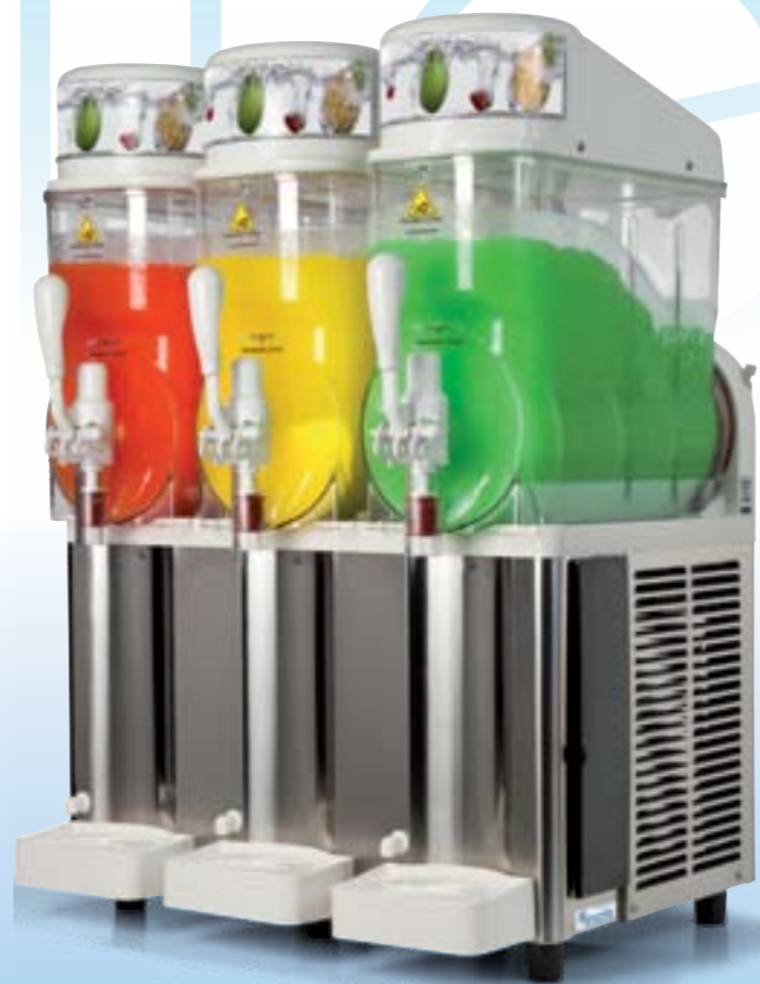
GHZ 342 FF

Versátil, de reducidas dimensiones, concebida para preparar y servir granizados, sorbetes y bebidas frías. Máquina con elevada capacidad productiva gracias a su depósito de 12 litros, fácilmente desmontable sin emplear herramientas, con lo que la limpieza se efectúa de manera sencilla y rápida. Estas máquinas salen de serie con el sistema incorporado FAST FREEZE, dotado de un circuito de refrigeración potenciado que permite abreviar notablemente el tiempo de preparación del producto. Este modelo resulta ideal para locales en los que se piden con frecuencia granizados, sorbetes y otras bebidas frías y se requiere, por tanto, una máquina extraordinariamente rápida y eficaz. La máquina viene además equipada con un termostato electrónico innovador, con un display digital, que señala la temperatura de la bebida. La solución está en consonancia con las nuevas regulaciones para el almacenamiento de bebidas.