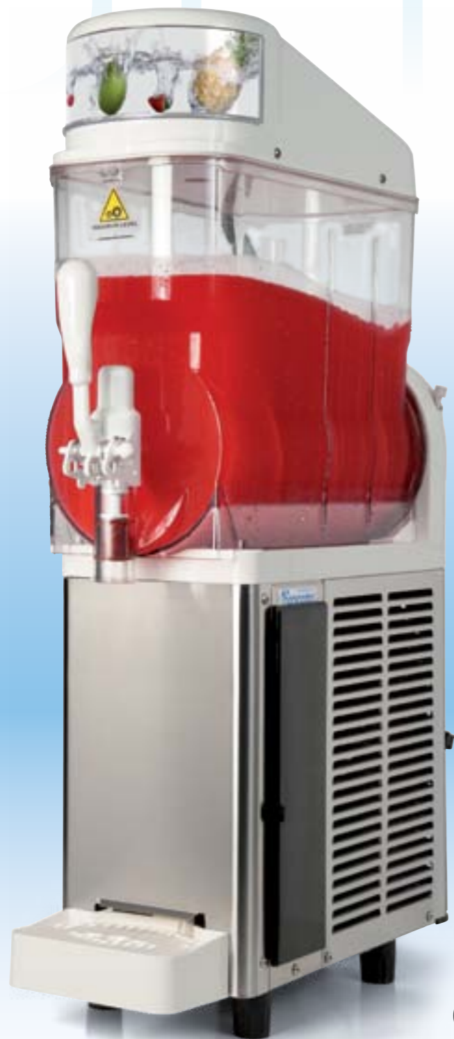
GHZ 114 FF